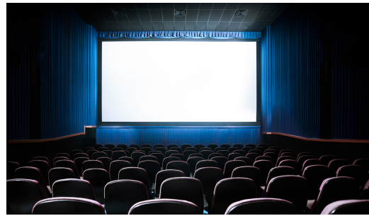
受賞講演/口頭発表/総会会場